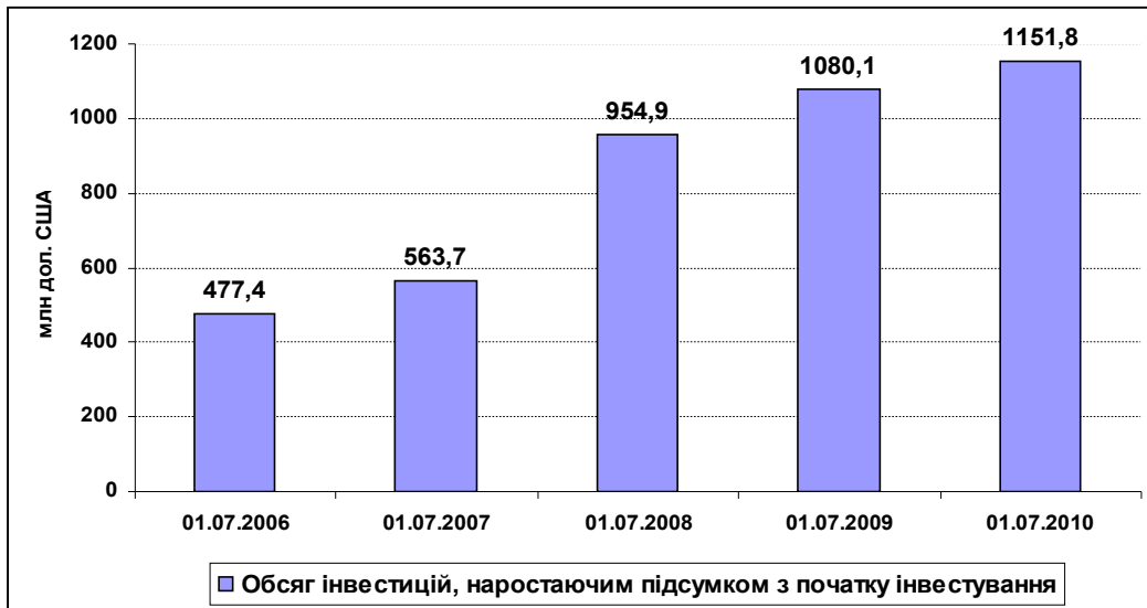
Рис. 1. Прямі іноземні інвестиції в Львівську область, млн дол. США [5].